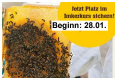
Jetzt Platz im Imkerkurs sichern! Beginn: 28.01.

...bietet das Umweltbildungszentrum wieder im Rahmen der Aktion "Rotenburg summt und brummt" an (BUND, Imkerverein, Stadt, UBZ). Anmeldung über: 04261/6 30 56 74 oder per Mail: a.schulenberg@ubz-wuemme.de .